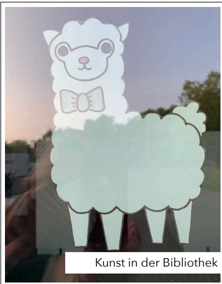
Kunst in der Bibliothek