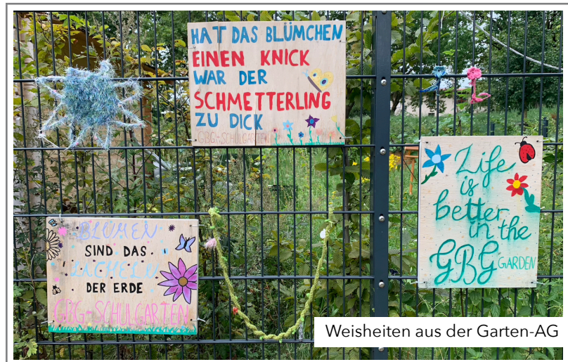
Weisheiten aus der Garten-AG